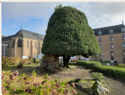
Le houx centenaire devant l'ancien Petit Séminaire, transformé en gîte d'étape.

Lourdoueix-Saint-Michel a été rattachée à l'Indre, il y a deux siècles. Cette commune était auparavant davantage liée à la Creuse à laquelle elle ressemble plus géographiquement, avec son relief vallonné annonçant les collines de la Marche et la Vallée de la Creuse. Son patrimoine architectural comprend, dans le bourg, des édifices à l'origine religieux, ainsi que le château du Plaix Joliet (XIII e siècle).