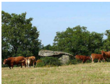
Dolmen de la Pierre Là

Un gros caillou, de près d'un demi-mètre cube, maintient l'écartement entre le support de granit noir et la pierre schisteuse.