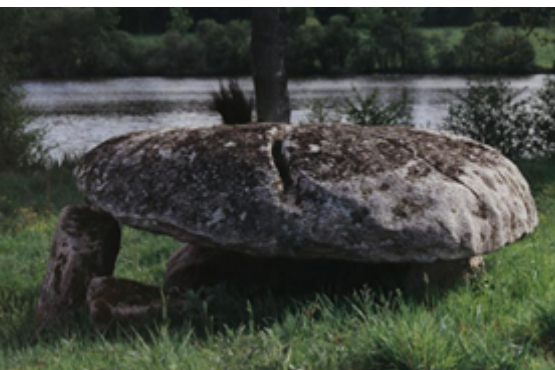
Dolmen du chardy