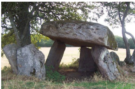
Dolmen de la Pierre à la Marthe